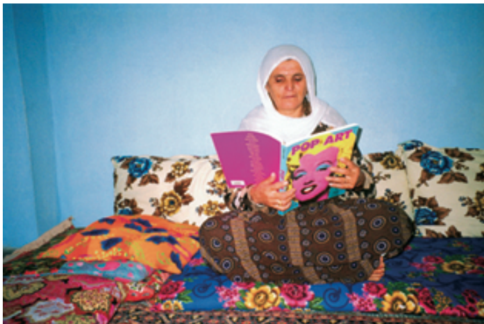
Halil Altindere „My Mother Likes Pop Art Because Pop Art is Colorful“, 1998

In diesem Zusammenhang rückt das ‘Zeitgenössische’ in den Vordergrund. Eine neue Künstlergeneration beansprucht Zeitgenossenschaft, um sich von der Moderne mit ihrem hegemonialen Anspruch zu lösen.